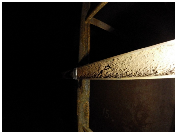
腐食のテストピース